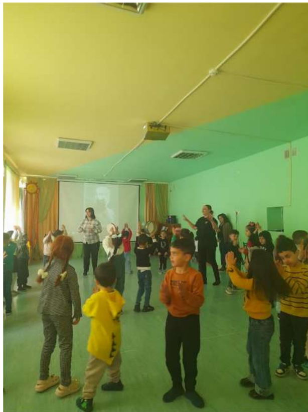
6. ՈՒՍՈՒՄՆԱԿԱՆ ՀԱՍՏԱՏՈՒԹՅԱՆ ԶԱՐԳԱՅՆՈՂ ՄԻՋԱՎԱՅՐԸ